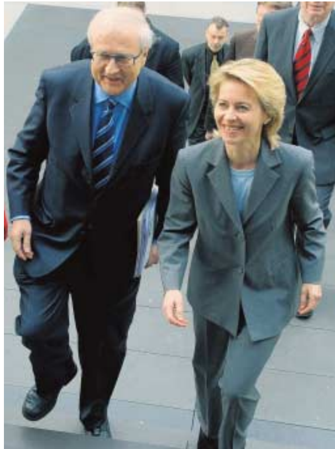
Es geht aufwärts: Arbeitsministerin Ursula von der Leyen und Wirtschaftsminister Rainer Brüderle sind optimistisch.

PROGNOSE Wirtschaftsminister Rainer Brüderle sieht „kleines Jobwunder“